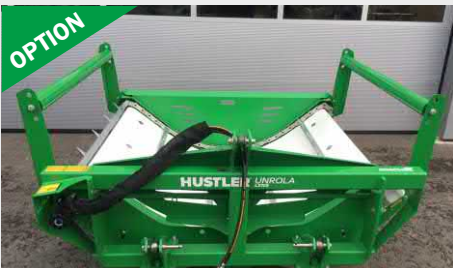
Barres latérales pour Unrolla LX105 Barres latérales rotatives optionnelles avec hauteur ajustable pour garantir une excellente distribution des balles difficiles