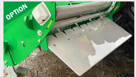
Défecteur pour Unrolla LX105 Option offrant un déport de chute de fourrage de 40 cm, idéal pour la distribution depuis l'avant