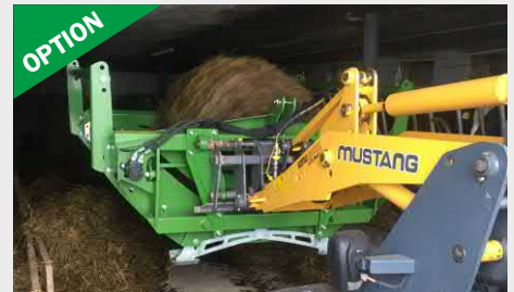
Kit ferrures autres normes D'autres types de ferrures sont disponibles pour l'adaptation sur chargeuse, valet de ferme, télescopique...