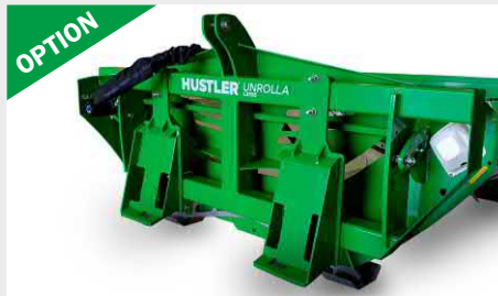
Kit ferrures chargeuse compacte Adaptez votre dériveuse sur une chargeuse compacte type Bobcat grâce à des ferrures angulaires / poutres double T