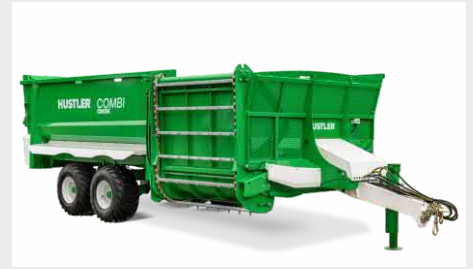
Combi CM156 Remorque distributrice combinée pour tous types d'aliments (balles, ensilage, betteraves fourragères...)