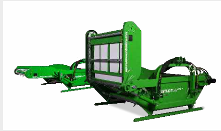
LM105 Dériveuse 3-points avec décharge latérale, idéale pour la distribution en auge