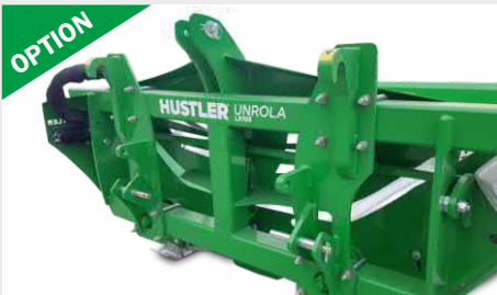
Kit multi-ferrures 3-point/Euro Passez d'un attelage 3-points à un attelage Euro rapidement et sans outils !