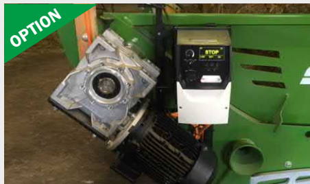
Unité électrique indépendante Motoréducteur de 2,2 kW avec réglage continu. Idéal pour la distribution stationnaire en étable